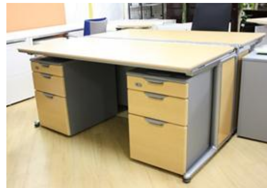
オカムラ システムデスク フォレスII