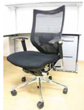
オカムラ バロンチェア