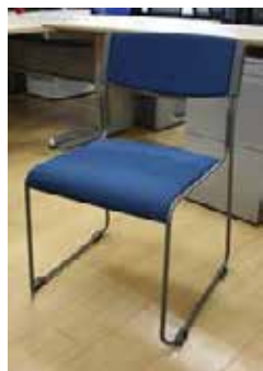
会議用スタッキングチェア