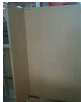
木製パーティション H1650